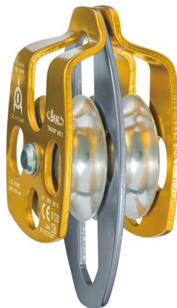
TRANSF'AIR 2B 高效双滑轮