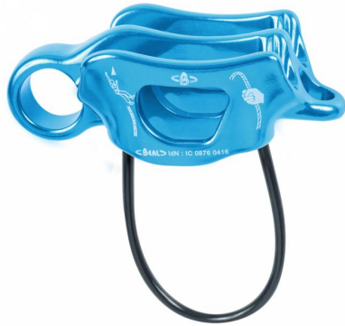
AIR FORCE 3 保护器