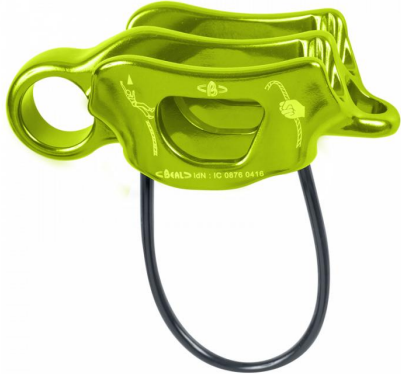
AIR FORCE 3 保护器